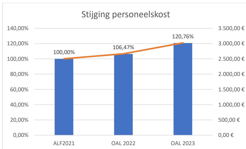
Fig. de loonkostevolucie van 1 representatief team (9 medewerkers) uit Oost-Vlaanderen.

Er is in het eerste OAL-jaar een stijging die merklijk sterker is dan de verwachte. De stijging is meer dan dubbel zo hoog ten opzichte van het voorgaande schooljaar. Op anderhalf jaar tijd gaat dit in bovenstaand praktijkvoorbeeld over 20% op anderhalf jaar.